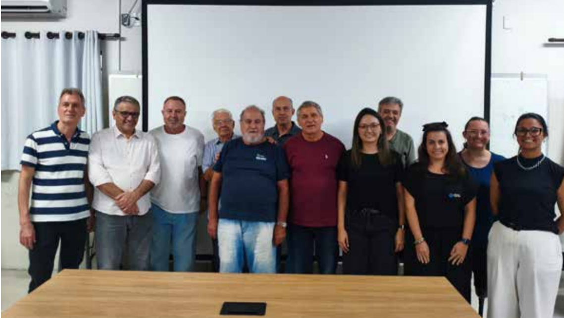
Diretoria do Patrulheiro Valinhos

Entidade conecta jovens ao trabalho e promove inclusão