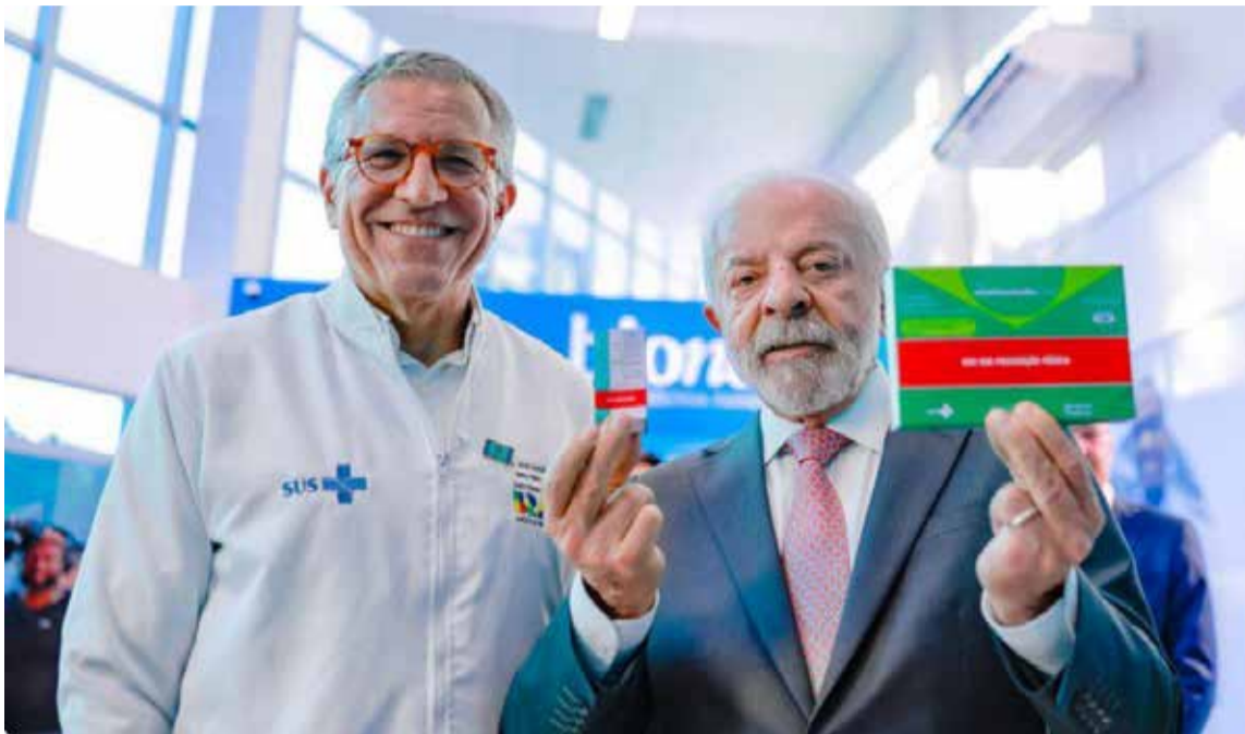
Presidente e ministro Alexandre Padilha alertam sobre impactos da guerra no Oriente Médio na logística de medicamentos durante visita à Bionovis.

Presidente conheceu as instalações da Bionovis na última terça-feira, dia 3, e reforçou meta de autonomia do SUS; fábrica recebeu R$ 650 milhões do BNDES