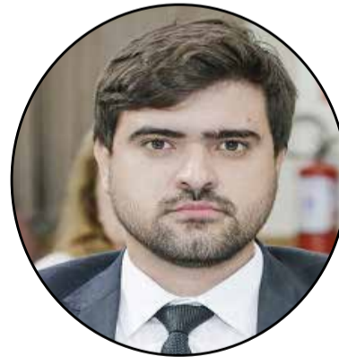
análise nas comissões.

O texto prevê multa por descumprimento e prazo de seis meses para adequação dos estabelecimentos. A matéria segue em