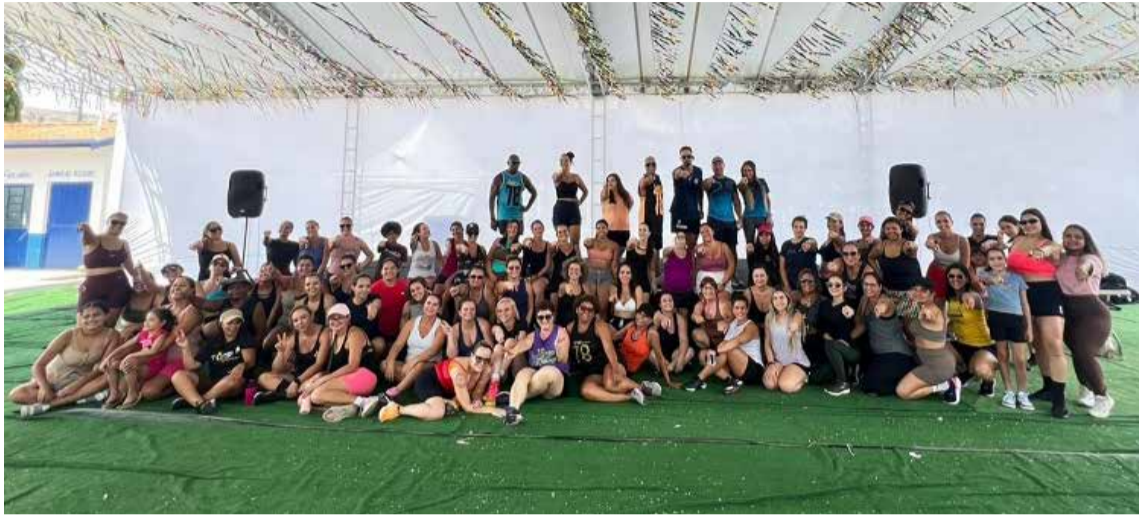
Profissionais das academias, da Secretaria de Esportes e Lazer e público participante no palco do Projeto Verão 2026

Programação gratuita reúne palestras, aulas e ações de saúde neste sábado, 28 e domingo 1º