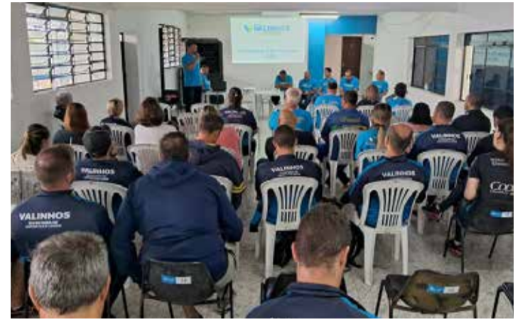
Abertura oficial das atividades foi realizada no Clube Municipal

DA REDAÇÃO A Secretaria de Esportes e Lazer, realizou reunião oficial de abertura das atividades de 2026 com cerca de 40 professores de diversas modalidades. O encontro, no Clube Municipal, apresentou os projetos prioritários, diretrizes administrativas e metas para os próximos três anos.