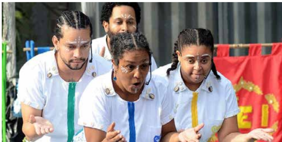
Somos Todos Chico Rei SESC

Valinhos integra o Roteiro 5 com oficinas criativas, realidade virtual e espetáculos teatrais; evento promovido pelo Sesc reúne música, circo e literatura em programação diversificada para todas as idades