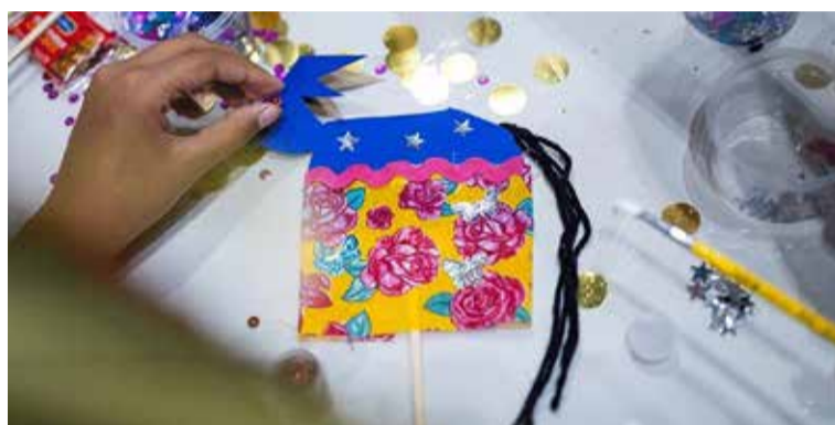
Boi Bumbá SESC

A programação começa às 15h e inclui atividades para todas as idades. Entre os destaques estão oficinas criativas, experiências tecnológicas e apresentações artísticas que