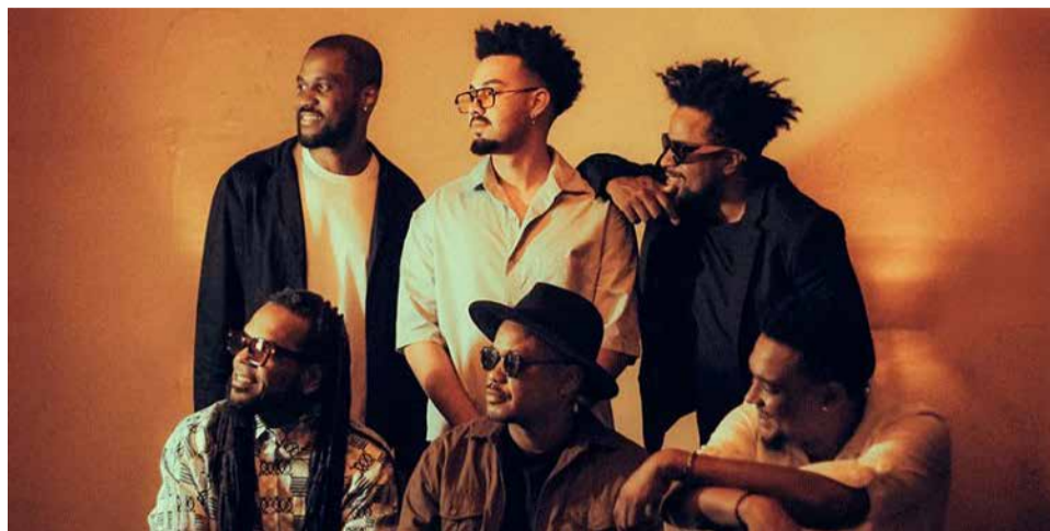
Sons de Jorge 1 SESC