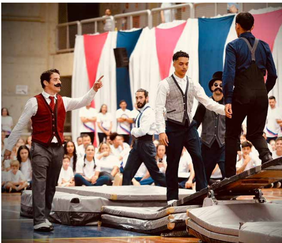
Teddy Boys - SESC