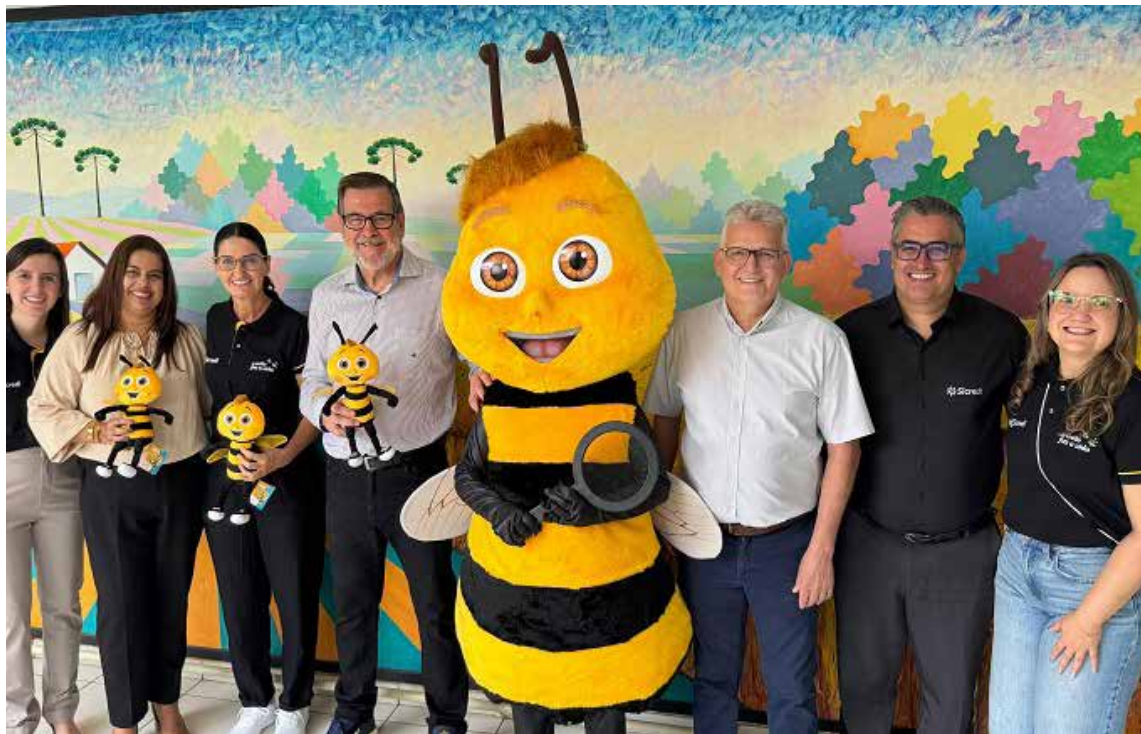
Profissionais da APAE, representantes do SICREDI