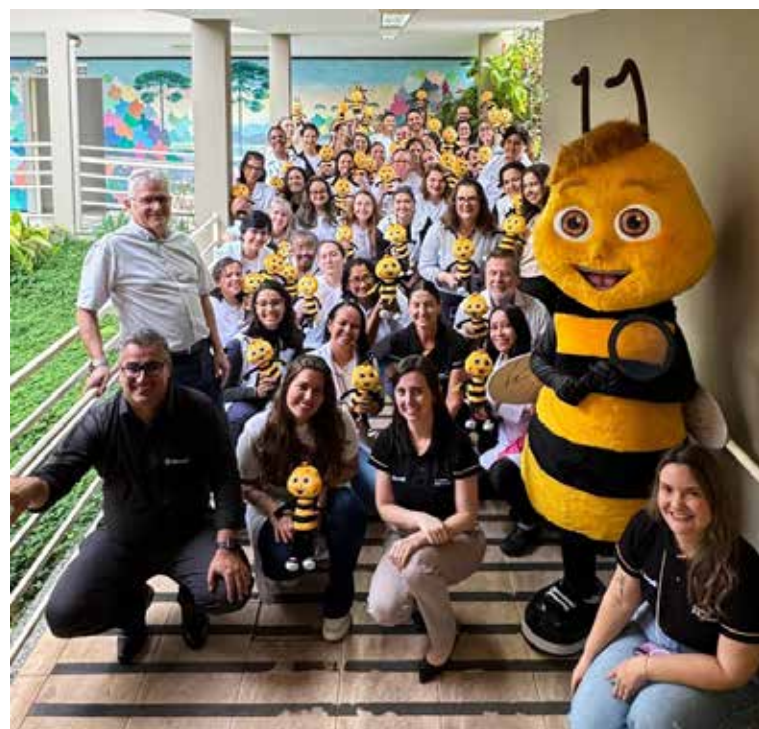
Apresentação da Abelinha mascote do projeto

“A União Faz a Vida” desenvolve atitudes de cooperação e cidadania, conectando o aprendizado com a vida real e a comunidade.