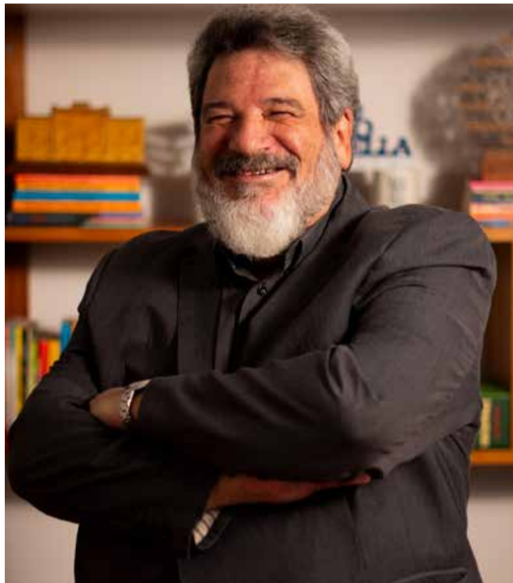
Mário Sergio Cortella

Cortella é um dos nomes mais reconhecidos do pensamento contemporâneo brasileiro. Autor de 54 livros, tem trajetória de 35 anos na