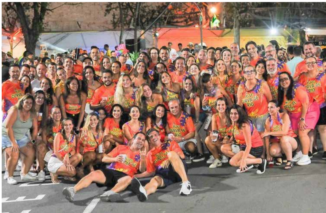
Bloco "Curva de Rio" alegram o Pré-Carnaval do Clube Atlético Valinhense em 2025

Clubes e festas públicas movimentam a cidade com bailes, matinês e blocos até terça-feira, dia 17