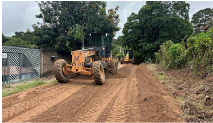
Alameda das Macieiras no Parque Valinhos

Em bairros com vias de terra, como Chácara Alpinas e Parque Valinhos, retroescavadeiras e tratores são utilizados para restabelecer o tráfego e garantir o