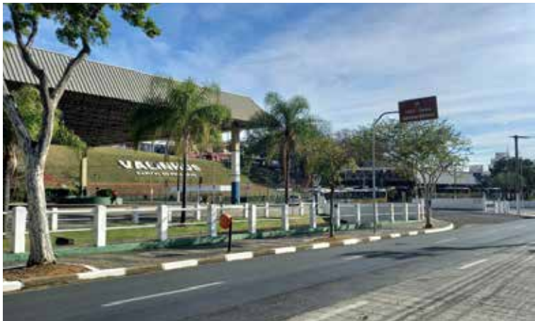
A largada será às 9h do Centro de Artes, Cultura e Comércio Adoniran Barbosa (CACC) com duração prevista de uma hora e meia

Integrando a programação oficial da Festa do Figo e da Expogoiaba, o Passeio Ciclístico reforça o caráter familiar, esportivo e solidário do evento, além de incentivar hábitos saudáveis e a convivência comunitária em Valinhos.