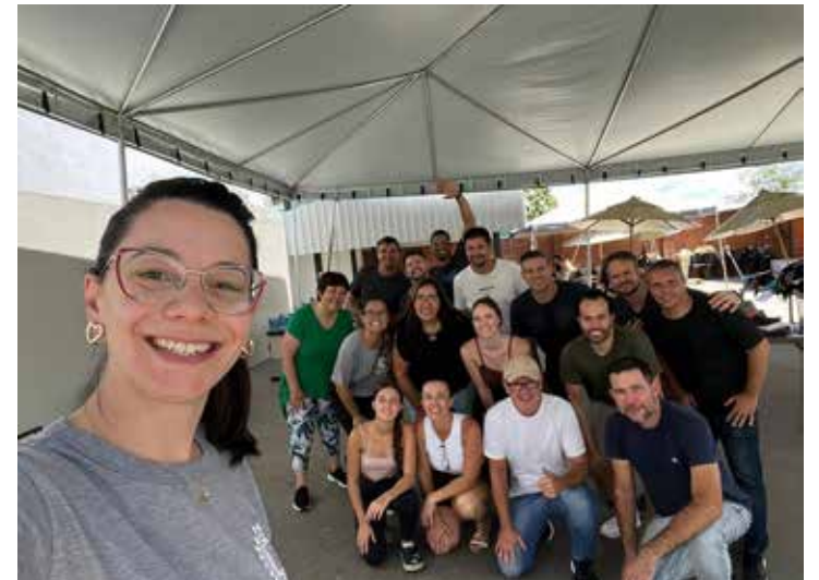
Equipe de voluntários da EATON que atuou no Bazar do Patrulheiro

Iniciativa contou com apoio da EATON e arrecadação revertida integralmente aos atendidos