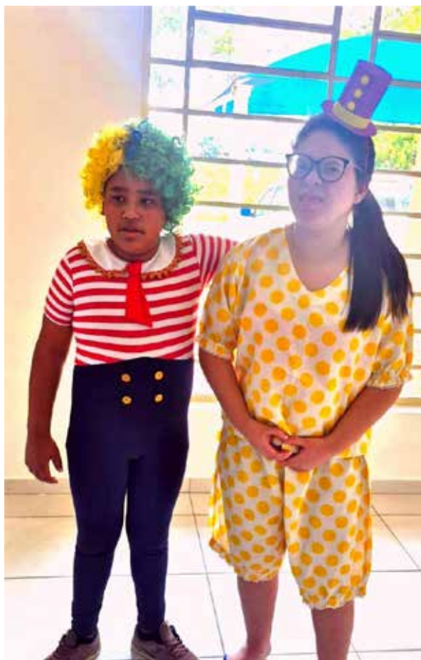
Usuários da APAE fazem a prova dos figurinos para o grande dia