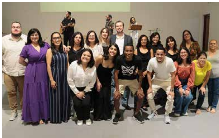
Diretores e colaboradores da aces