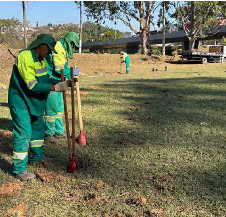
2ª MICROFLORESTA: Alça do Viaduto Laudo Natel é preparada

Lançamento da Microfloresta Vale dos Ipês e Adesão ao Programa Arborização + Segura Data: domingo, 21 de setembro Horário: 9h Local: alça de acesso do Viaduto Laudo Natel, sentido centro