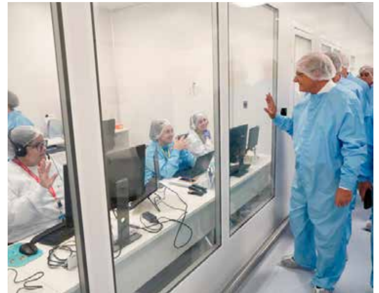
Alckmin visitou na segunda-feira, dia 10, a planta da Bionovis, em Valinhos, onde celebrou anúncio da aprovação da Anvisa para a fabricação do insumo farmacêutico

Vice-presidente visitou a Bionovis em Valinhos, onde celebrou a aprovação da Anvisa para a fabricação do insumo farmacêutico