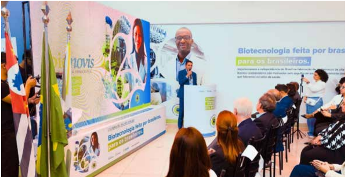
Prefeito Franklin discursa em evento da Bionovis, em Valinhos: fabricação do Insumo Farmacêutico Ativo - IFA

Cidade se destaca no cenário nacional com investimentos em inovação e desenvolvimento na saúde, promovendo avanços tecnológicos e melhorias nos serviços à população