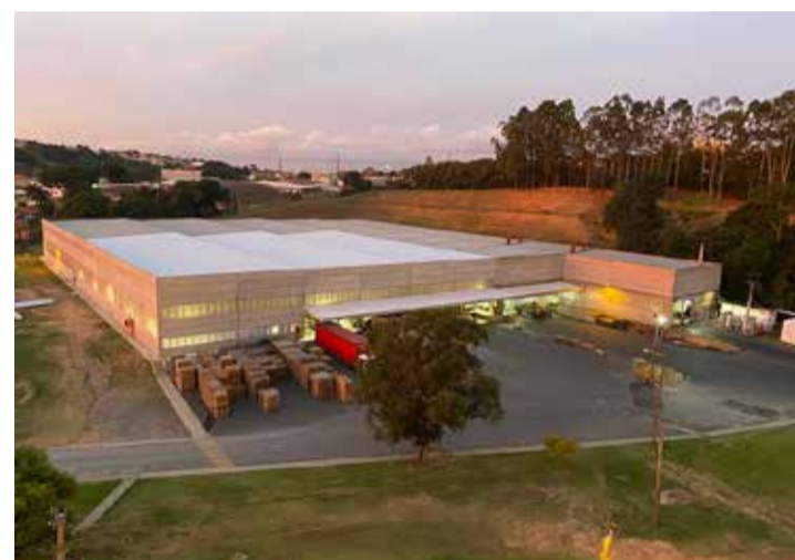
Planta industrial moderna do Cartonificio Valinhos

Ao longo de seus 90 anos de história, o Cartonificio Valinhos se consolidou como referência em seu segmento. A empresa acompanhou a evolução do mercado e investiu em tecnologia e inovação, sempre com foco na qualidade de seus produtos e na preservação do meio ambiente.