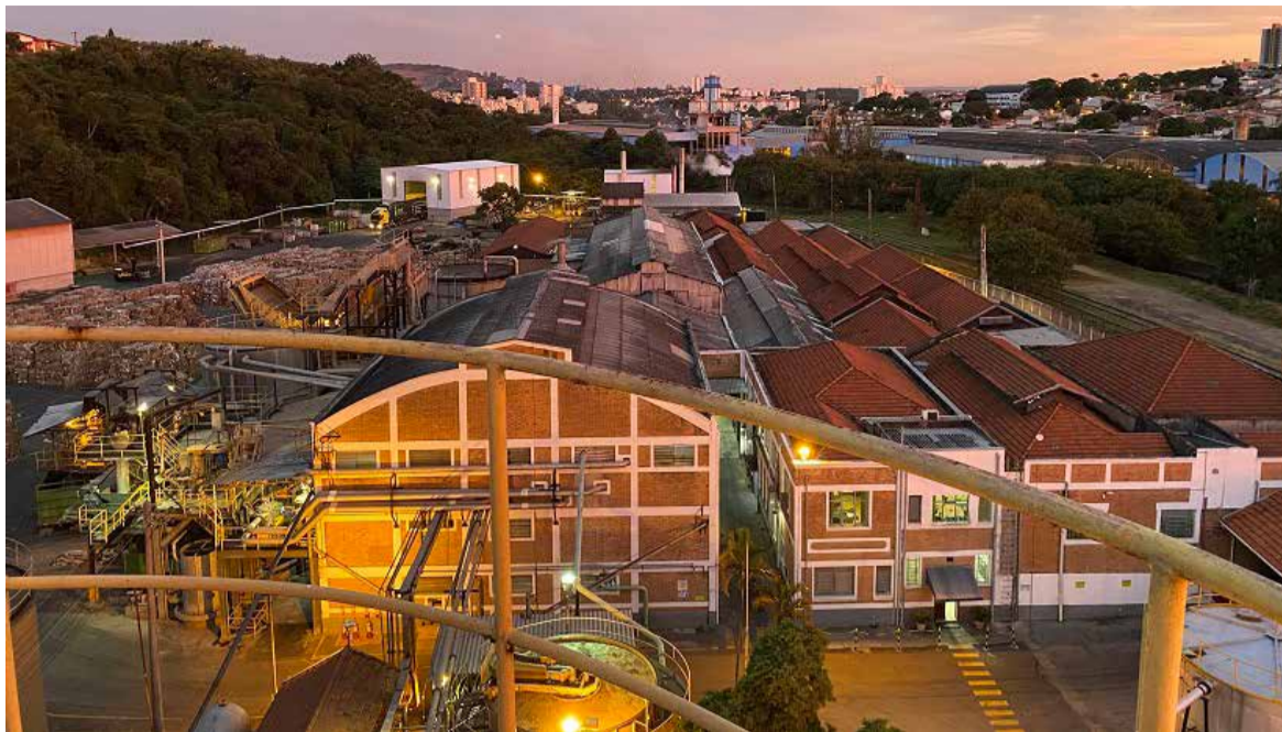
Sede da empresa Cartonificio, onde tudo começou em 1934