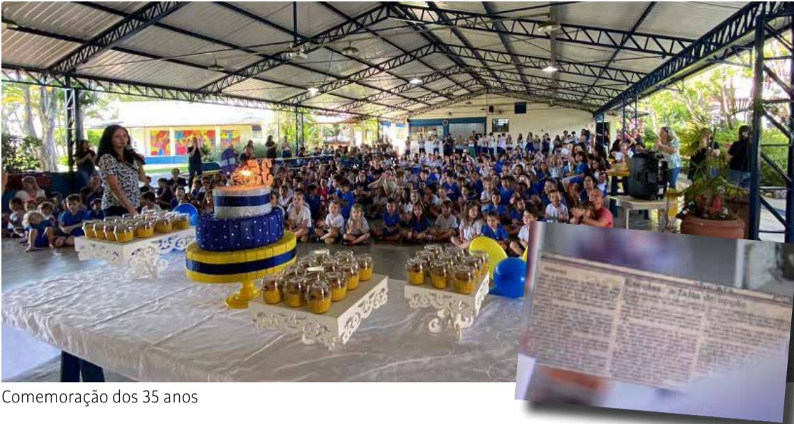
Comemoração dos 35 anos