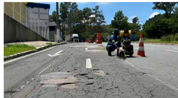
Avenida Invernada sendo preparada