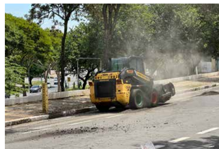
Trecho da avenida Independência

É importante destacar que essas duas vias do Vale Verde são endereços de indústrias e empresas da cidade. Aguardada há anos pela classe empresarial, a obra tem valor de R$ 2.273.317,91, com contrapartida da Prefeitura de Valinhos e verba do Ministério das Cidades, que destinará ao Município R$ 1,5 milhão de reais, a partir de emenda parlamentar do deputado Carlos Sampaio.